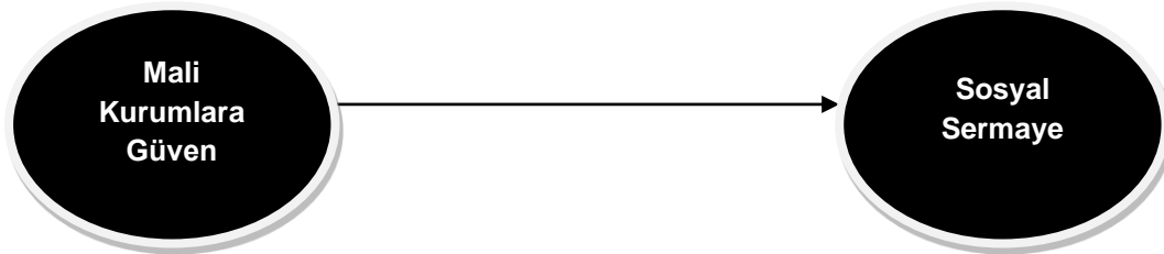
Şekil 1: Araştırmanın Temel Teorik Modeli

Araştırmanın temel teorik modeli ise aşağıda Şekil 1'de yer almaktadır.